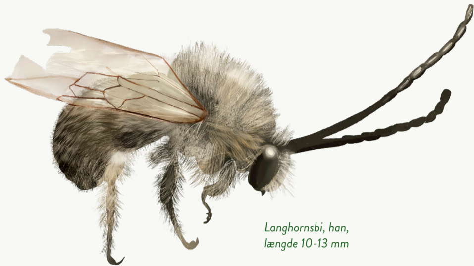
Langhornsbi, han, længde 10-13 mm