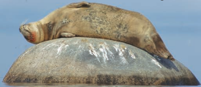
En spættet sæl hviler og fordøjer med fiskeblod om munden.

...selve ordet sæl kommer formodentlig fra et gammelt germansk ord Selha som betyder "Den, der slæber sig af sted".