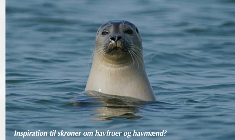
Inspiration til skrøner om havfruer og havmænd?

Skemaet herunder viser forskelle på de to arter af sæler, der lever i Danmark.