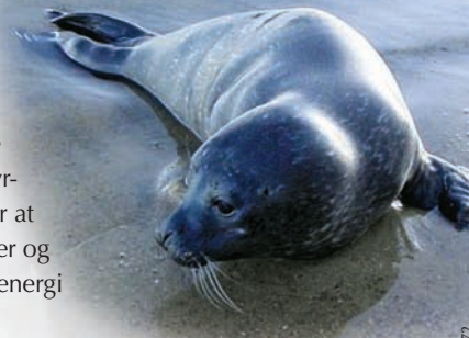
Ung af spættet sæl ved Avnøs kyst.

Men ser du en sælunge ved kysten på Avnø, vil vi dog gerne vide det. Du kan give besked om, hvor den er, og hvornår du har set den. Skriv i logbogen, send en mail (kah@nst.dk) eller læg en besked på telefonsvareren (55 36 63 46) på Avnø Naturcenter.