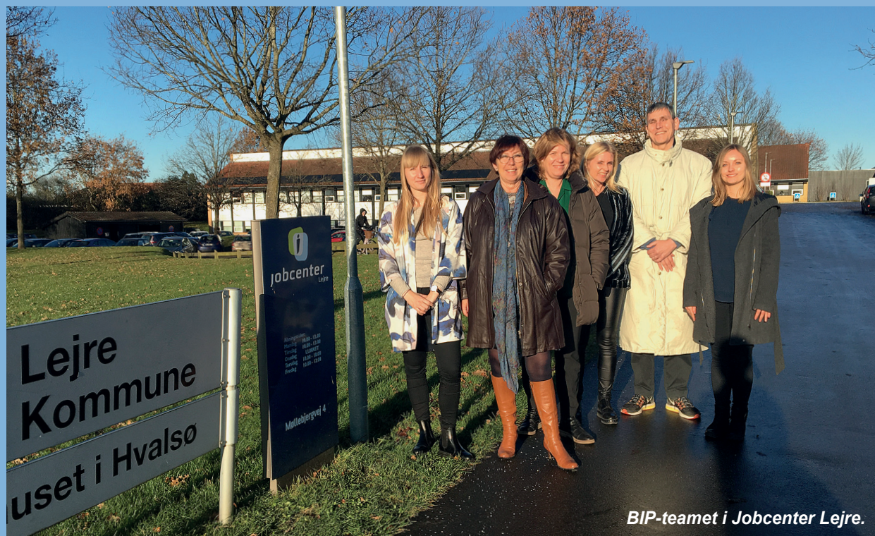
BIP-teamet i Jobcenter Lejre.

Kommunerne har i øjeblikket en "historisk chance for at få flere med" - sådan lyder ordene fra beskæftigelsesminister, Troels Lund Poulsen, i et brev til kommunerne. I brevet opfordrer han til at trække på viden fra Væksthusets Forskningscenters Beskæftigelses-IndikatorProjekt (BIP) i indsatsen. Projektet har bl.a. resulteret i identifikationen af en række indikatorer for arbejdsmarkedsparethed. I samspil med progressionsmåling giver indikatorerne en unik mulighed for at måle på andet end blot, om borger kommer i beskæftigelse eller ej, nemlig også på de små skridt på vejen, der peger mod det endelige slutmål.