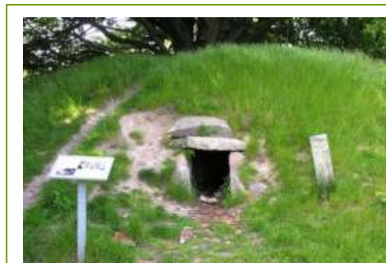
Knudshoved, høj med jættestue