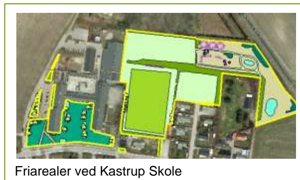
Friarealer ved Kastrup Skole