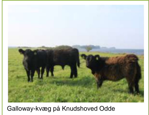
Galloway-kvæg på Knudshoved Odde

Knudshoved Græsningforening medvirker til naturplejen i området mellem Draget og Knudsskøvs østlige afgrænsning.