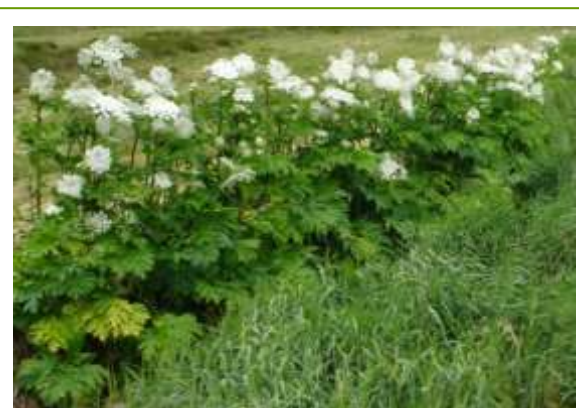
Kæmpe-Bjørneklo langs vandløb

Vordingborg Kommune foretager i dag bekæmpelse af planten på offentlige arealer i lokalområdet.