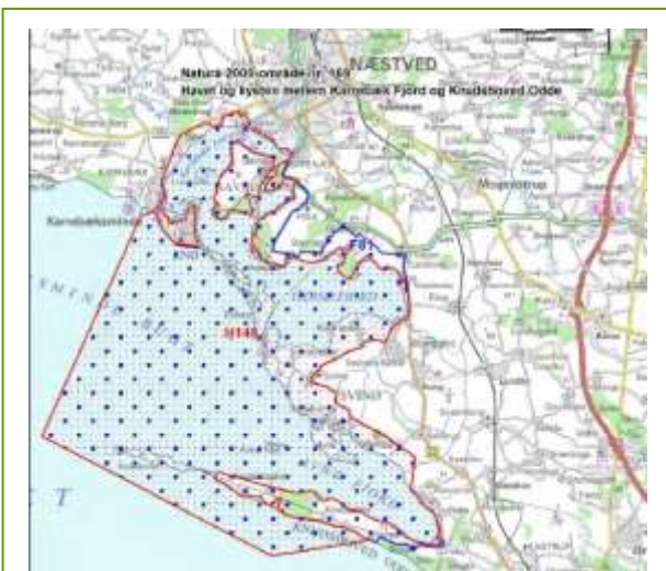
Natura 2000-område 169 (Miljøministeriet 2011)

Potentielle yngle- og rastelokaliteter for internationalt vigtige forekomster af vand- og kysttilknyttede fuglearter og for spættet sæl skal have tilstrækkelig lav prædation og forstyrrelse. Forudsætninger for opnåelse af bæredygtige bestande af klokkefrø skal være tilvejebragt.