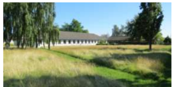
Eksempel på klippede stier i langt græs.

Driften af arealet kunne ekstsiveres, så smutvejen bevares, mens den øvrige græsflade får lov at stå uklippet. Evt. kunne arealet tilplantes med forårsblomstrende løg og buske med smukke høstfarver for at skabe årstidsvariation.