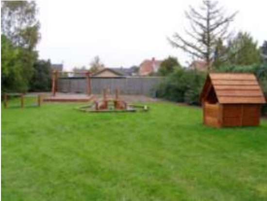
Legepladsen i Kastrup