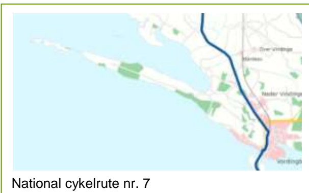
National cykelrute nr. 7

Den nationale cykelrute nr. 7 krydser området ad cykelstien langs Næstvedvej. Ruten går fra Rødbyhavn til Sjællands Odde.