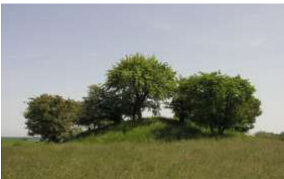
En af højene på Knudshoved

Af de bedst bevarede og mest spændende fortidsminder i Vordingborg Kommune er 52 beskrevet på Fortidsmindeguiden, www.fortidsmindeguide.dk , og på de konkrete lokaliteter er der opsat informationstavler. Enkelte steder er der også anlagt parkeringspladser ved fortidsmindet. Adgang til og formidling af fortidsminderne prioriteres højt.