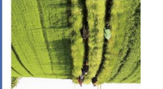
Der Naturpfad von Fjord zu Fjord beginnt (er endet), wo der bordet, bænke og toilet. Her er det slut (eller begyndelse) på Naturstien. Her er bordet, bænke og toilet. Ca. 300 meter længere mod Præsto findes endnu en parkeringsplads.

Der Naturpfad führt Ihnen die Möglichkeit die schöne und vielfältige Landschaft mit ihren Fjorden, Küsten, Wäldern, dem interessanten Tier- und Pflanzenleben und den kulturhistorischen Gedenkstätten zu entdecken. Viel Vergnügen.