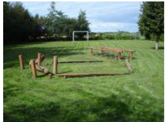
Legeplads i Borre

Driften af legepladsen fortsættes uden ændringer.