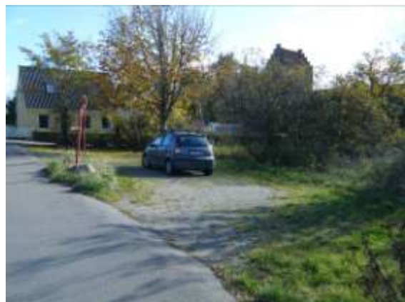
P-plads foran Keldby Gadekær

Keldby gadekær ligger midt i Keldby ud til Klintevej. Alle, der er på vej til Møns Klint, passerer stedet. En parkeringsplads foran gadekæret skæmmer det ellers klart velafgrænsede rum. Der er mulighed for synlige forbedringer ved en generel oprydning og fjernelse af ukrudt og støds kud langs kanten af gadekæret. I 2013 er placeret et bord/bænkesæt for at opfordre til ophold.