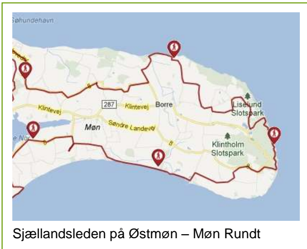
Sjællandsleden på Østmøn – Møn Rundt

Vandreruten North Sea Trail løber gennem området. North Sea Trail er sammenfaldende med den regionale vandrerute Sjællandsleden.