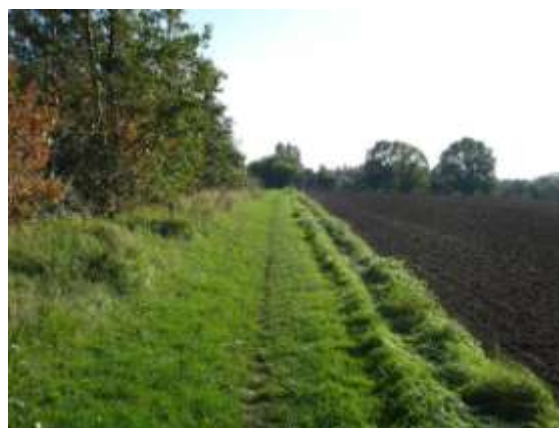
Sti mellem Hjertebjerg og Råbylille