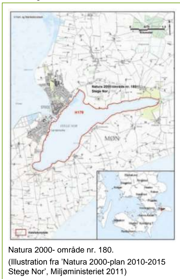
Natura 2000- område nr. 180.

Stege Nor er en typisk kystlagune med det snævre udløb ved Stege by. Vandet er brakvand, og mere ferskt end havet omkring Møn. Området omfatter også norets vandpåvirkede bredzone. Kysten omkring noret består af rørsump og afgræssede strandenge.