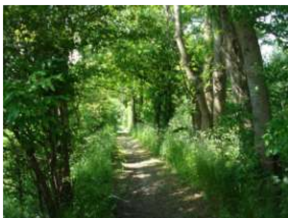
Kirkesti i Magleby

Kirkestien følger gamle skel og hegn fra Magleby Kirke til Klintholm Gods. En varieret tur igennem herregårdslandskabet med store marker og gamle træer i skellet. Stien er meget varieret; nærmest godset er det en trampesti, der senere løber over i en lidt bredere sti, for til sidst – tæt på Magleby - at blive et bredt spor med klippede græsrabatter.