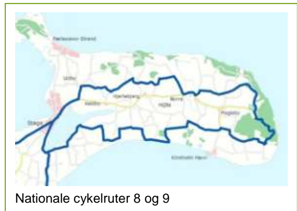
Nationale cykelruter 8 og 9

De nationale cykelruter 8 (Sydhavsruuten Rudbøl-Møn) og 9 (Helsingør-Gedser) kommer helt ud forbi Østmøns spids.