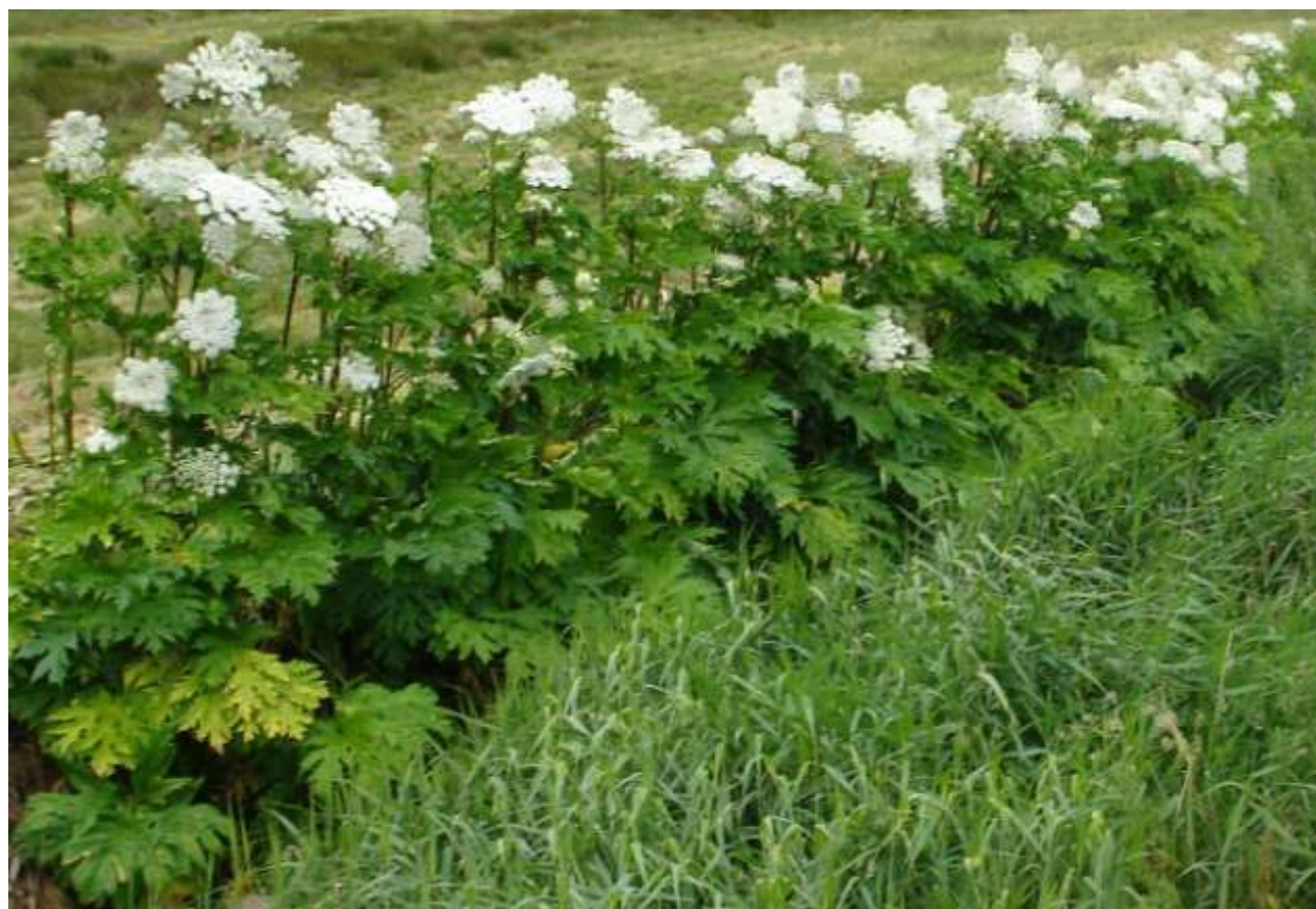
Kæmpe-Bjørneklo langs vandløb

Østmøn lokalområde bliver omfattet af en indsatsplan mod Kæmpe-Bjørneklo i 2014. Vordingborg Kommune foretager i dag bekæmpelse af planten på offentlige arealer i lokalområdet.