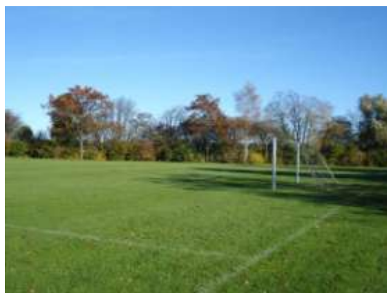
Boldbaner i Hjertebjerg

Driften af boldbanerne fortsætter på nuværende niveau.