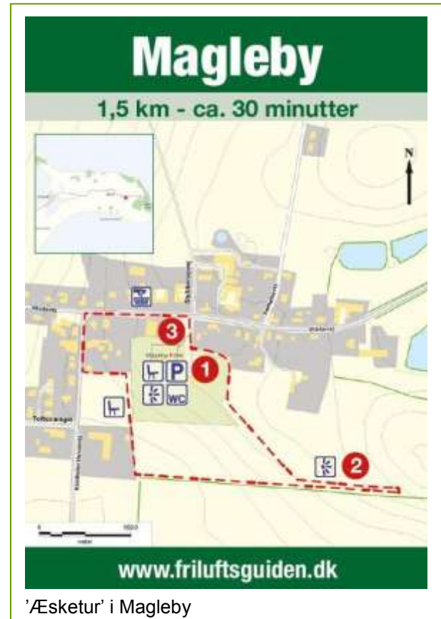
'Æsketur' i Magleby

'Æsketurene' er en samling af 12 ruter fra forskellige lokaliteter i Vordingborg Kommune, samlet i en lille handy æske. Samlingen er blevet til i samarbejde mellem Vordingborg Kommune og Region Sjælland. Ruterne er ganske korte og kan benyttes som inspiration til en motionstur i hverdagen. En af ruterne løber gennem Magleby.