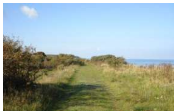
Sti ved Ålebæk Strand