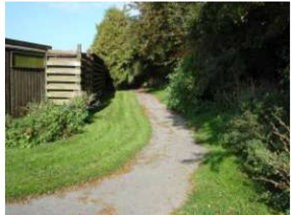
Sti ved Katinkavej

Stien fører fra Katinkavej til plejecenteret, og flankeres af klippede græsband. En del af stien er asfalteret, og det er et lokalt ønske at hele stien får denne overflade for at forbedre færdselsmulighederne med rollator. En bænk at hvile sig på undervejs ville også gøre stien mere anvendelig for de ældre borgere i området.