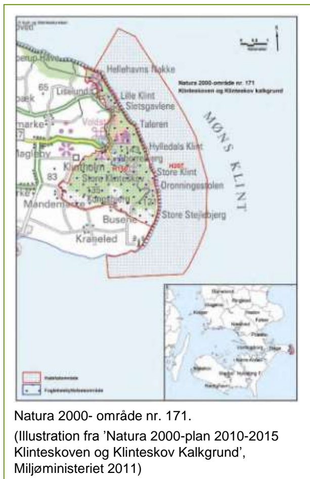
Natura 2000- område nr. 171. (Illustration fra 'Natura 2000-plan 2010-2015 Klinteskov og Kliteskov Kalkgrund', Miljøministeriet 2011)

Området indeholder også kalkoverdrev med nogle af landets vigtigste orkideforekomster. Området som helhed er levested for mange sjældne og rødlistede arter, hvoraf kan nævnes orkideen horndrager og dagsommerfuglen sortpletet blåfugl. Begge arter findes i Danmark kun her. Vandrefalken har ynglet fast på klinten siden 2001.