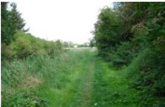
Sti til Råbylille Strand