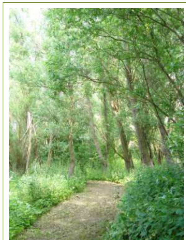
Sti ved mosen ved Klintholm Havn

Den videre udvikling og formidling af mosen sker i samarbejde mellem Natursekretariatet og Borger- og Grundejerforeningen.