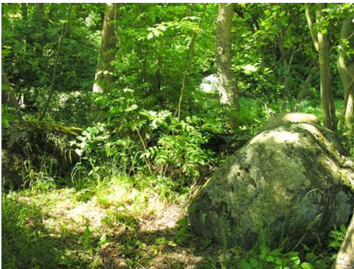
Stemningsbillede fra Klinteskov

Tal i parentes henviser til oversigtskort på side 6, 8 og 23.