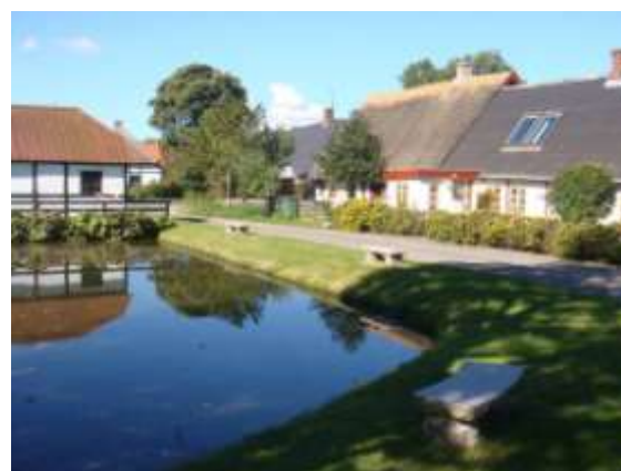
Sømarke Gadekær, en gammel smediedam

Gadekæret ligger midt i landsbyen Sømarke og er en klassisk smediedam med stort, frit vandspejl, skrånende græsplæner og skråning med rød hestehov ned mod vandet, et gammelt solitært ahorntræ og bænke. Her kan man mødes, sætte sig og kigge på livet i vandet og landsbyen.