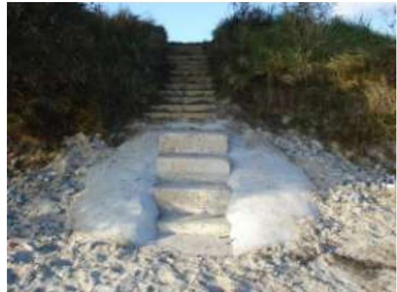
Adgang til stranden ved Vængegårdsvej

Ved Vængegårdsvej ligger en p-plads, som kan fungere som udgangspunkt for en god strandtur