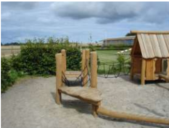
Legeplads i Klintholm Havn

Legepladsen ligger i udkanten af byen og er ikke let at finde for turister, så der skal gøres ekstra opmærksom på hvordan man finder herhen fra havneområdet.