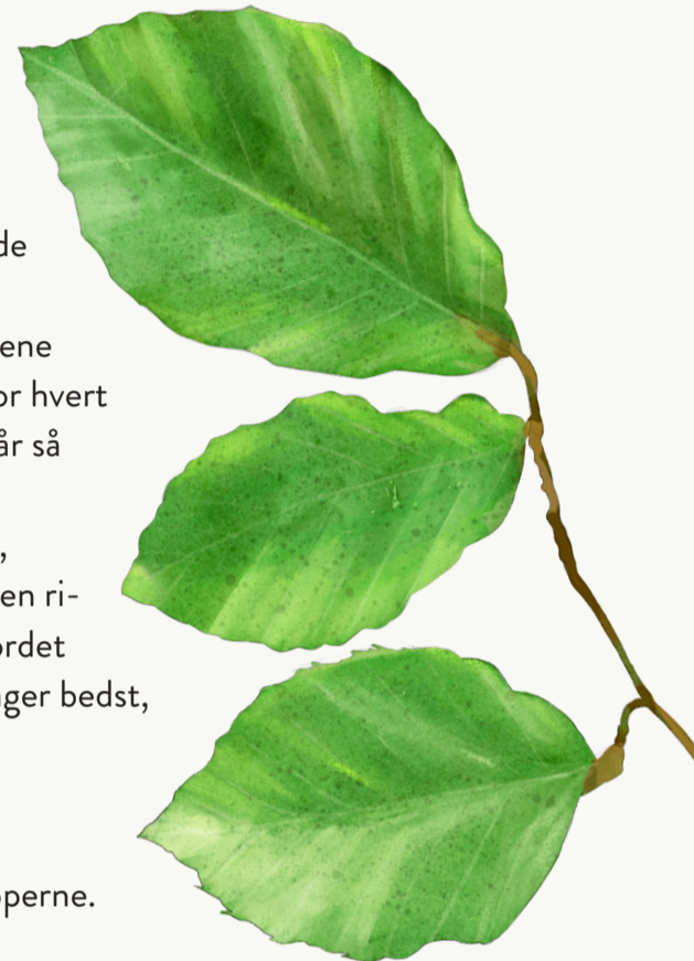
Almindelig bøg, Kvist og vintersilhuet

Bøgetræ bliver brugt til alt fra møbler, legetøj, ispinde og brænde. I jernalderen ristede man runer i bøgestave – deraf ordet »bogstav«. Bladene kan spises, og smager bedst, når de lige er sprunget ud.