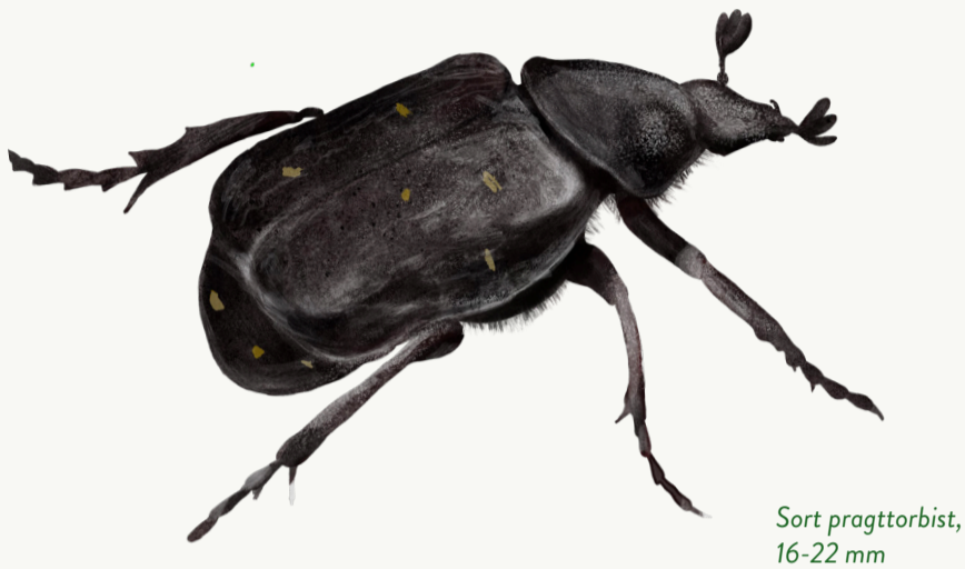
Sort pragttorbist, 16-22 mm

Er jorden ofte meget våd, bliver træet nemt ramt af svamp, og det er godt for torbisten.