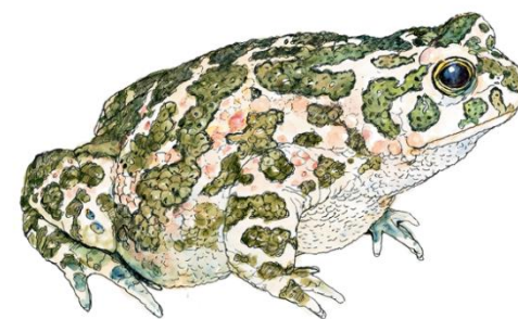
Føjleludse / Grønbogel ludse (Rana lessonae)