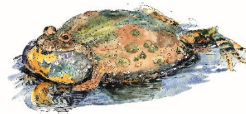
Rana lessonae (Rana lessonae) Krokkølle eller Gulgrønskalle