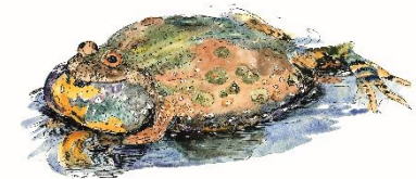
Rana lessonae (Rana lessonae) København, 1850