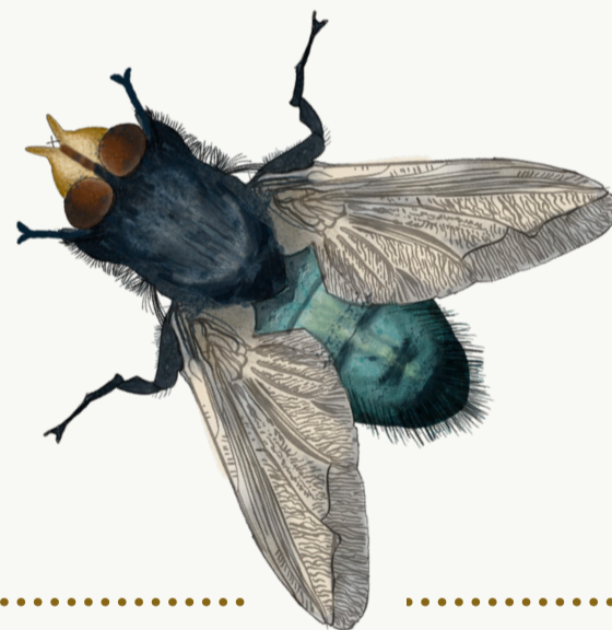
Dødsflue, 8-18 mm