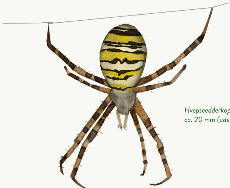
Hvepseedderkop, hun, ca. 20 mm (uden ben)

Edderkopper er spindlere og ikke insekter. Skorpioner og mider hører også til spindlerne. De har 8 ben, ingen vinger eller antenner.