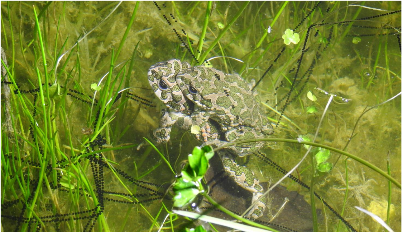
Grønbroget Tudse i parring i en af de nye biodiversitetssøer på Bogø.

Grønbroget tudse har tidligere været meget udbredt i på Farø, Bogø og Møn og Jordbassinene ved Stege havde måske Danmarks allerstørste bestand med flere tusinde voksne tudser i slutningen af 1980'erne. Desværre har bestanden været i voldsom tilbagegang i de sidste årtier og arten forsvandt i høj grad fra hele Biosfære området, ja selv bestanden i Jordbassinene uddøde. Naturplejeprojektet "Biodiversitetssøer i Biosfære Møn" har vendt den negative udvikling og i ca. halvdelen af de nyetablerede ynglesøer yngler den smukke tudse nu igen, lige som den på naturlig vis er godt i gang med at sprede sig ud i landskaberne på Farø, Bogø og Møn til stor glæde for de lokale beboere, som pludselig finder tudserne i haver, udhuse og stensætninger, samtidig med at beboerne glæder sig over tudsernes melodiske, trillende kvækken i forårmånederne.