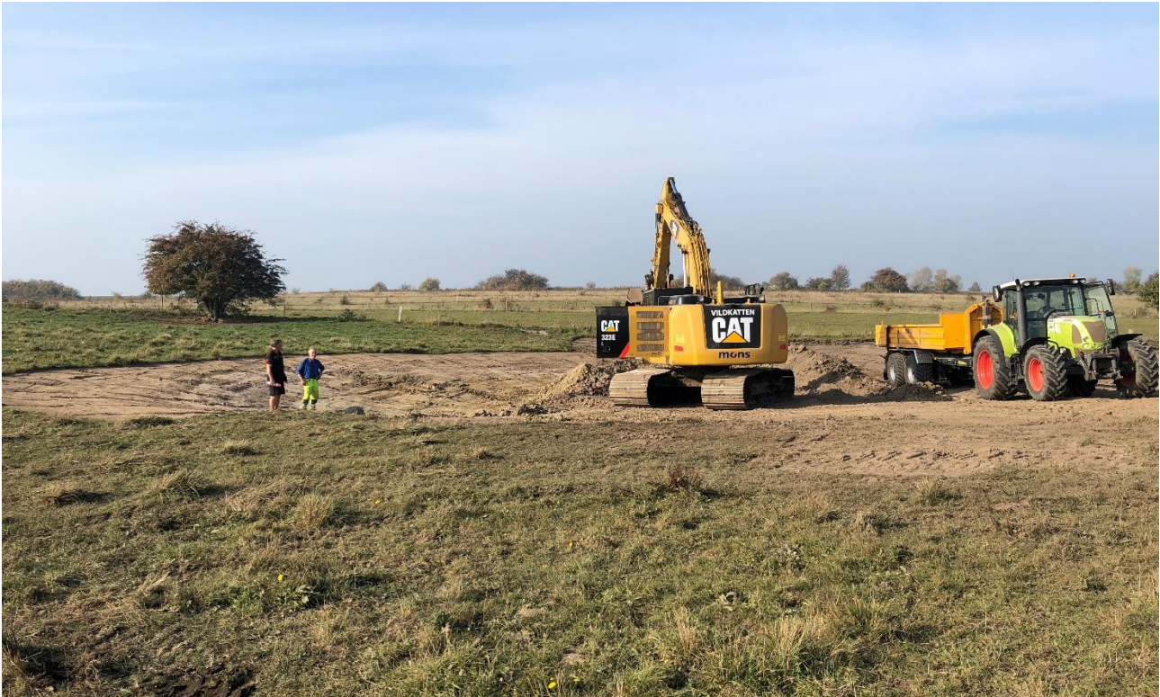
Etablering af ny ynglesø for padder på Bremavej, Bogø.