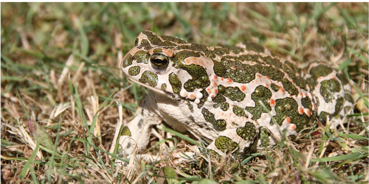
Grønbroget tudse er godt kamufleret til livet på afgræssede, sandede arealer.