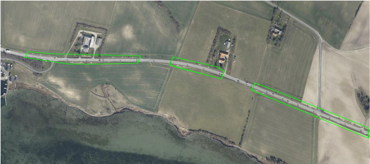
Bogø Sydøst: Anlæg af grusbunker til markfirben, ifm. gennemførelse af Den Danske Naturfond/Vordingborg Kommunes naturplejeprojekt "Biodiversitetssøer i Biosfære Møn". Grøn: Nye grusbunker for markfirben.