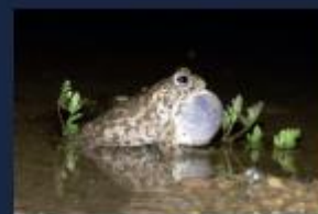
Strandtudse bliver op til 6-7 cm og kan kendes på sin vordede hud og den smalle gule rygstribe. Strandtudse er næsten uddød i Biosfære Møn. Døvsøens klimaforandringerne til at strandtudsen oftere overleveres fra havet, hvilket medfører at strandtudsen bliver for salt til at strandtudsernes haleduer kan overleve, samtidig med at der kommer fisk.