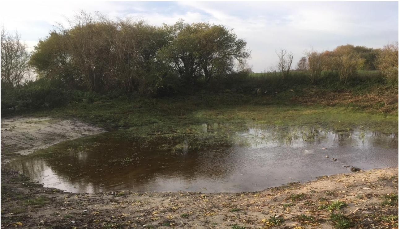
Bremavej, Bogø: Samme lokalitet, nyetableret ynglesø for padder efter oprensning. Den 1.000 m 2 store sø er ved at blive fyldt op af efterårsregnen.