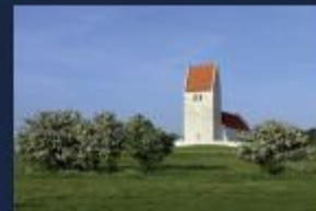
Et karakteristisk træk ved Biosfære Unesco-Område Møn er det rige kulturarvsstakit, der også omfatter nogle af Danmarks flotteste kirker med erstatende kalkmalerier: Farsøkirke og Emselunde Kirke er gode eksempler på dette og den gamle, røde byport i Stege og Stege Kirke er også meget bemærkelsesværdige.