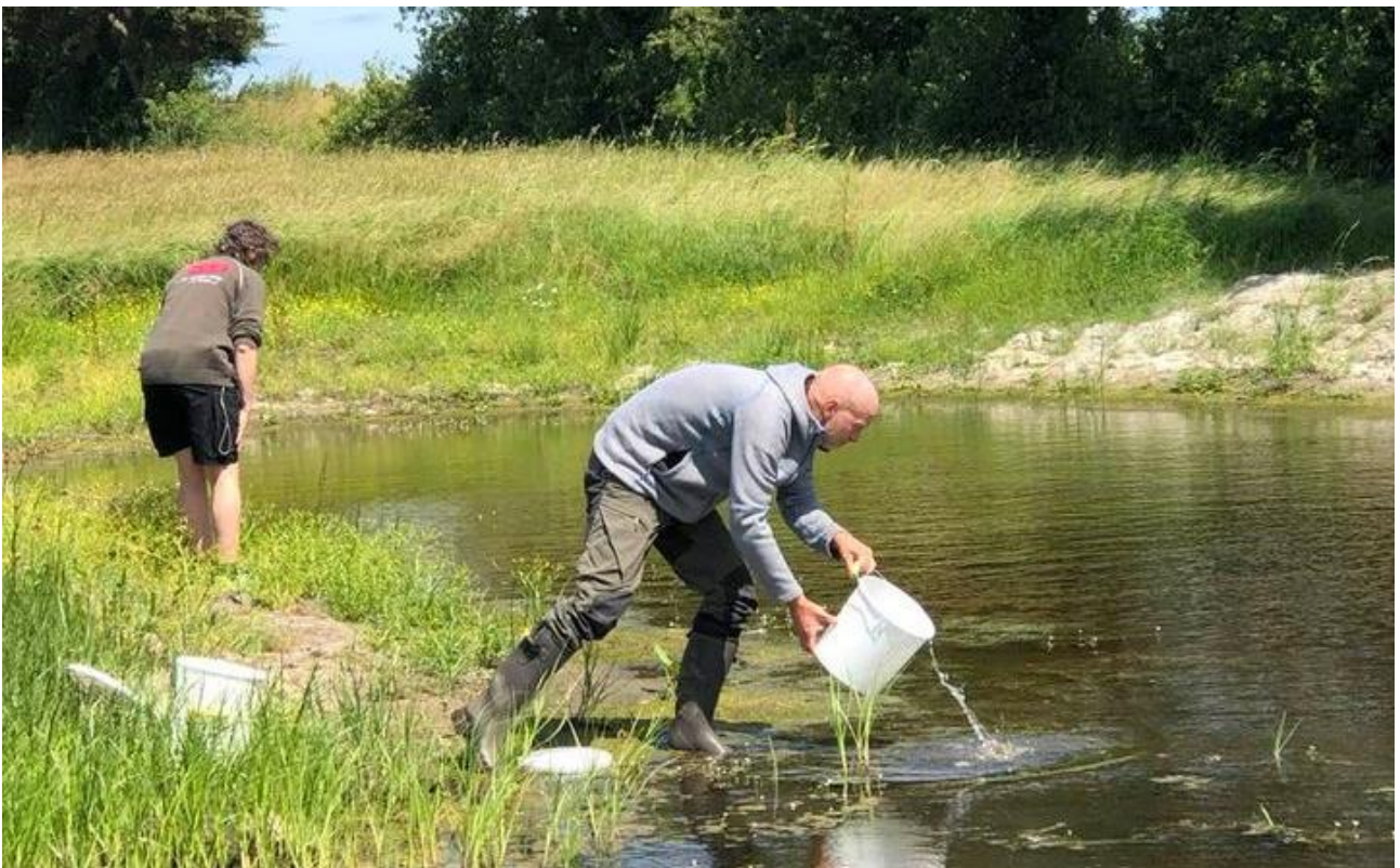
Udsætning af strandtudse-haletudser ved Fanebjerg, Møn.