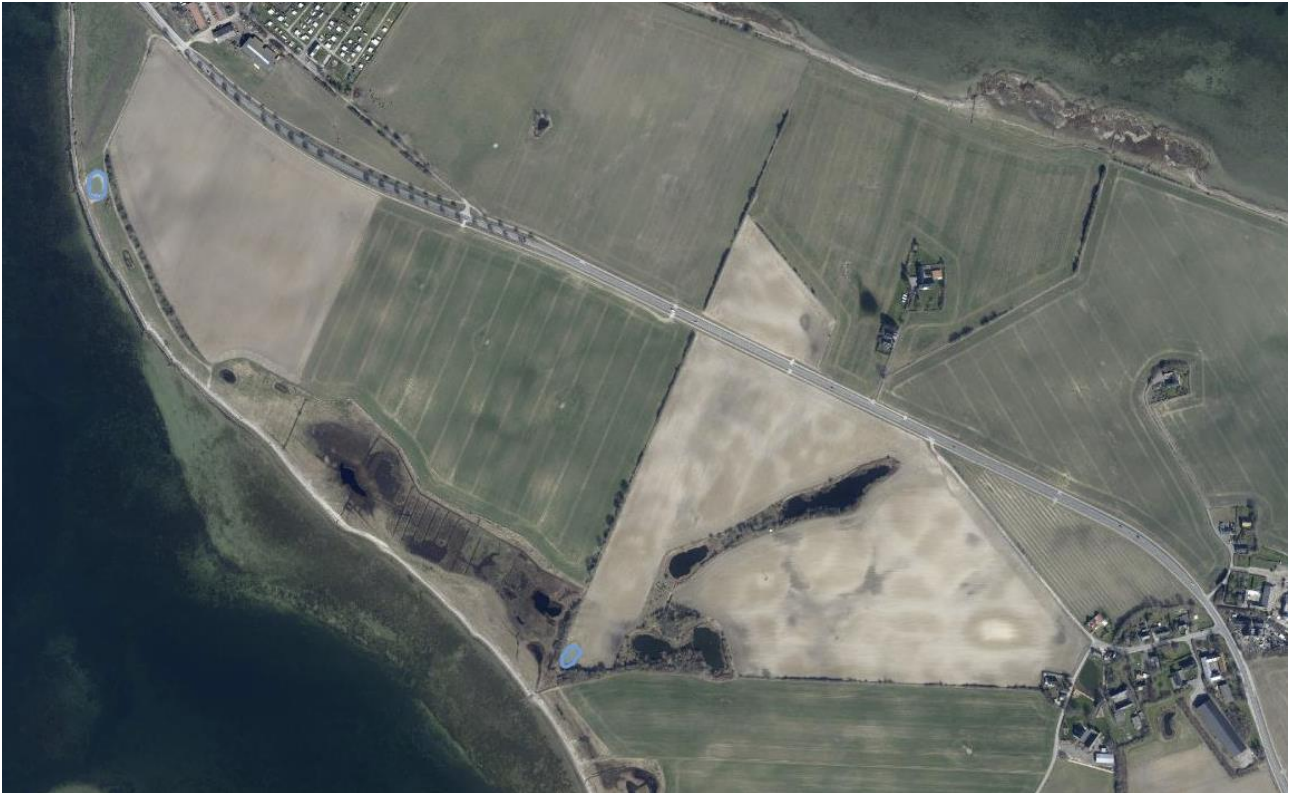
Koster, Møn: Etablering af nye søer og oprensede søer ifm. gennemførelse af Den Danske Naturfond/Vordingborg Kommunes naturplejeprojekt "Biodiversitetssøer i Biosfære Møn". Blå: Nye ynglesøer for padder.