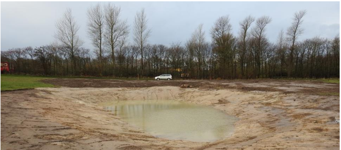
Bogø, Nordvest: Nyetableret ynglesø for padder

Rød: angiver placering af sø, som blev tildækket, da jordbundsforholdene var ugunstige.