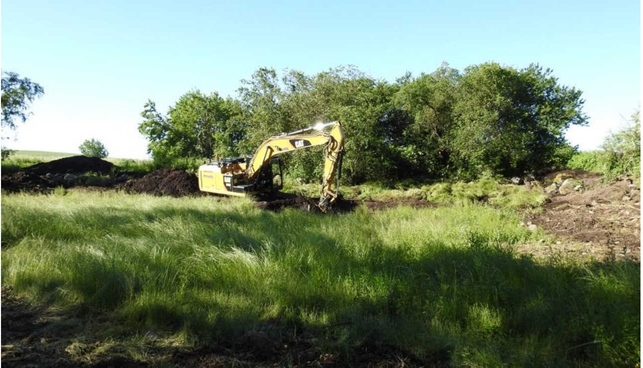
Oprensning af en udtørret og helt tilgroet sø på Bremavej, Bogø.