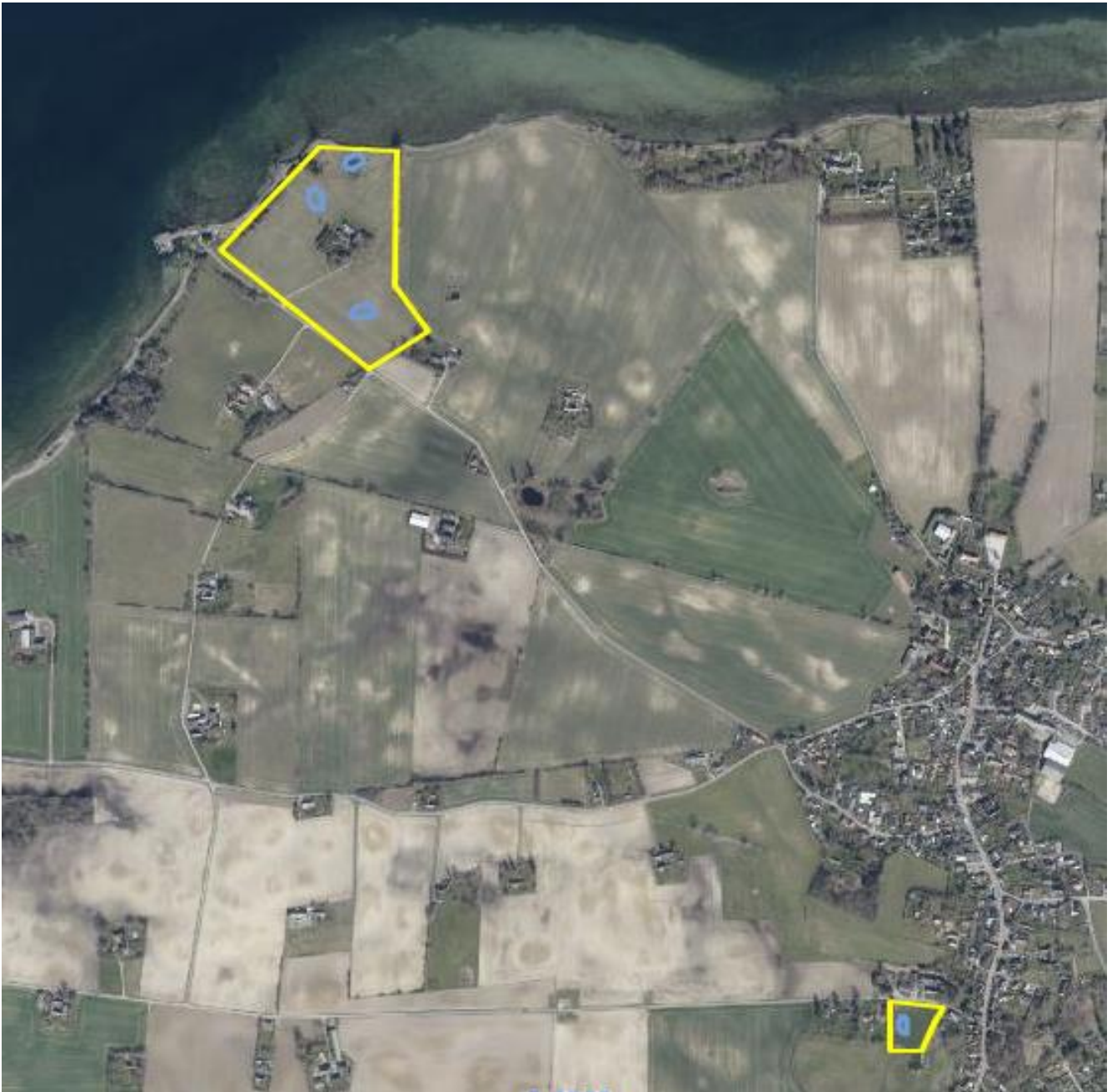
Bogø, Nord: Etablering af nye søer og oprensede søer ifm. gennemførelse af Den Danske Naturfond/Vordingborg Kommunes naturplejeprojekt "Biodiversitetssøer i Biosfære Møn". Blå: Nye ynglesøer for padder. Gul: Ny hegning.