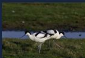
Den smukke vadefugt, klyde, yngler på små, ubevoksede "ragnes" revler og øer, hvor det er bevarligt for søv og kragefugle at komme til. Klyden bruger sit karakteristiske næb til at filtrere smådyr, otter og krebsdyr i det løse vand ved vadema langs kysten.