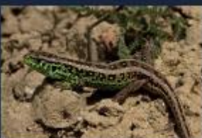
Mærkfirbenet, som bliver ca. 20 cm langt, findes fåtaligt på Bogø og Vestmøn på sølige, tørre og sandede steder ved kysten og på vejskråninger. De grønne hanner kæmper om turnerens gunst om foråret og lægger læggen i sand og grus og kvækker i august.