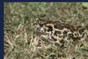
Den karakteristiske camouflerede grønbroget tudse findes meget fåtaligt på Vestmøn, Bogø og Farø. Den yngler i lavvandede, fiskefrie søer, på naturligt-græssede arealer, da kreaturerne holder bredvegetationen i søerne nede. Den vækstbærende art yngler i april-maj, hvor man om aftenen kan høre dens melodiske, trillende kvækken.