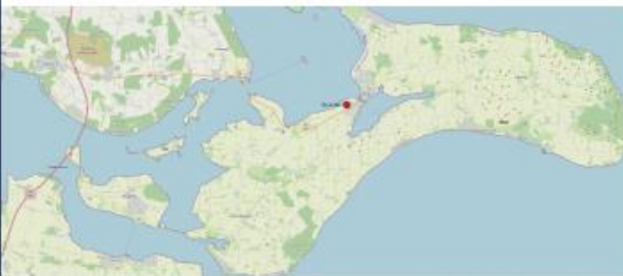
Delprojektområdet i Biosfære-naturplejeprojektets nordlige del forbinder og sikrer de sårbare bestande af grønbroget tudse og strandtudse fra Stege til Kosterland ved at skabe velegnede ynglesøer og afgræssede arealer.