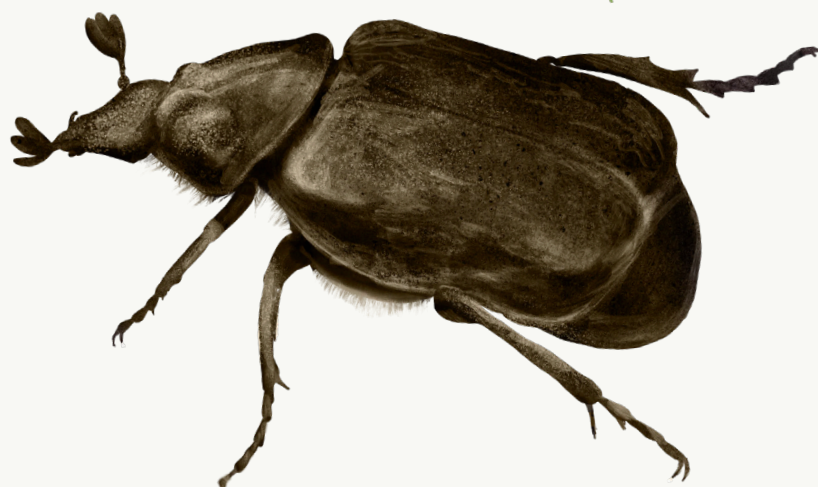
Eremit, 25-35 mm