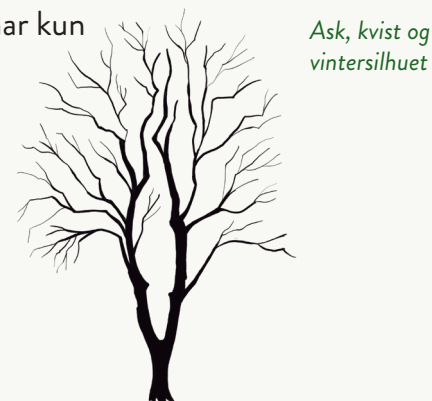
Ask, kvist og vintersilhuet