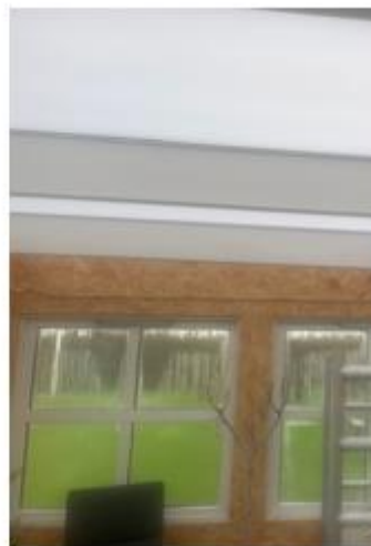
Figur 1: Fotos af orangeriet set fra vest samt fotos af orangeriet indefra.