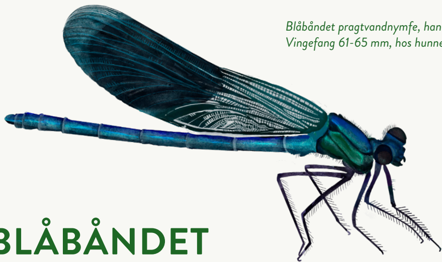
Blåbåndet pragtvandnymfe, han. Vingefang 61-65 mm, hos hunnen 65-70 mm