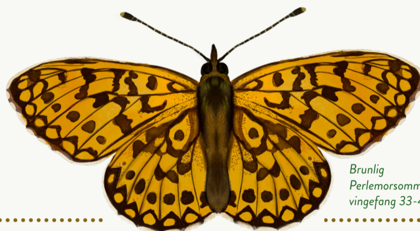
Brunlig Perlemorsommerfugl, vingefang 33-44 mm