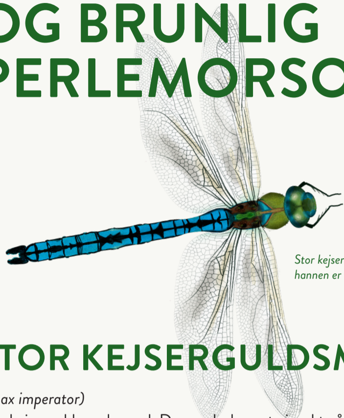
Stor kejserguldsmed, hannen er op til 84 mm lang