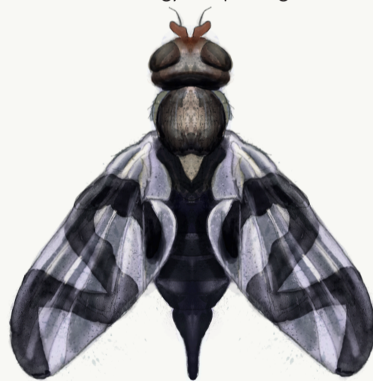
Tidselbåndflue, hun 4,5-6 mm lang