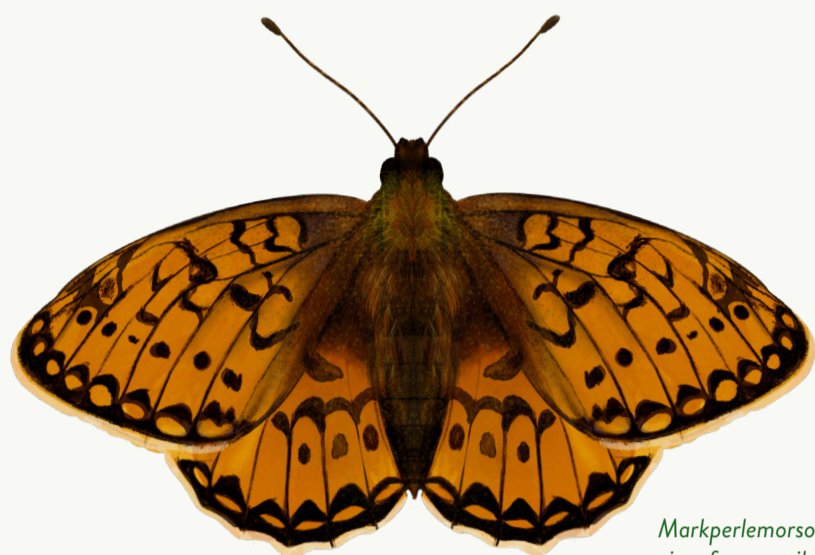
Markperlemorsommerfugl, vingefang op til 60 mm