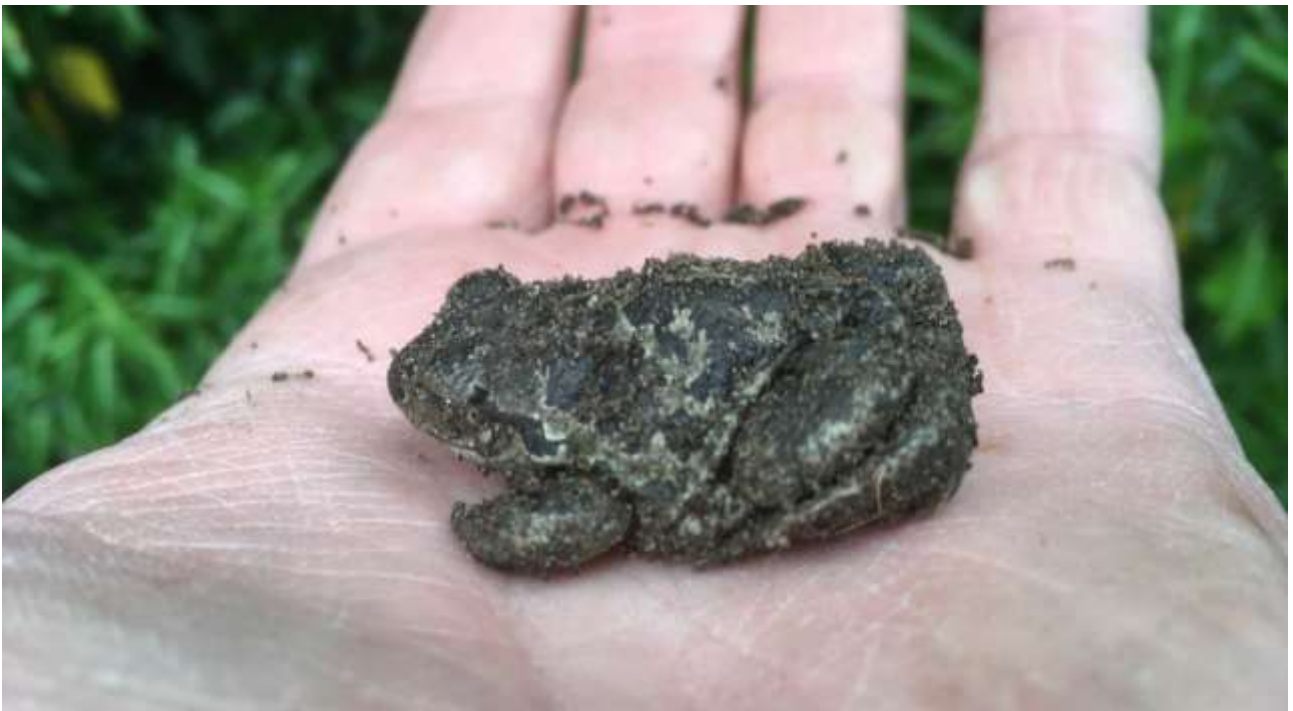
Løgfrø fra Knudshoved 2017

Løgfrøen er desværre endnu en paddeart som har haft en voldsom tilbagegang i de seneste hundrede år. Bestanden på Knudshoved er således den eneste sikre forekomst på Sjælland udenfor det nordøstsjællandiske område.