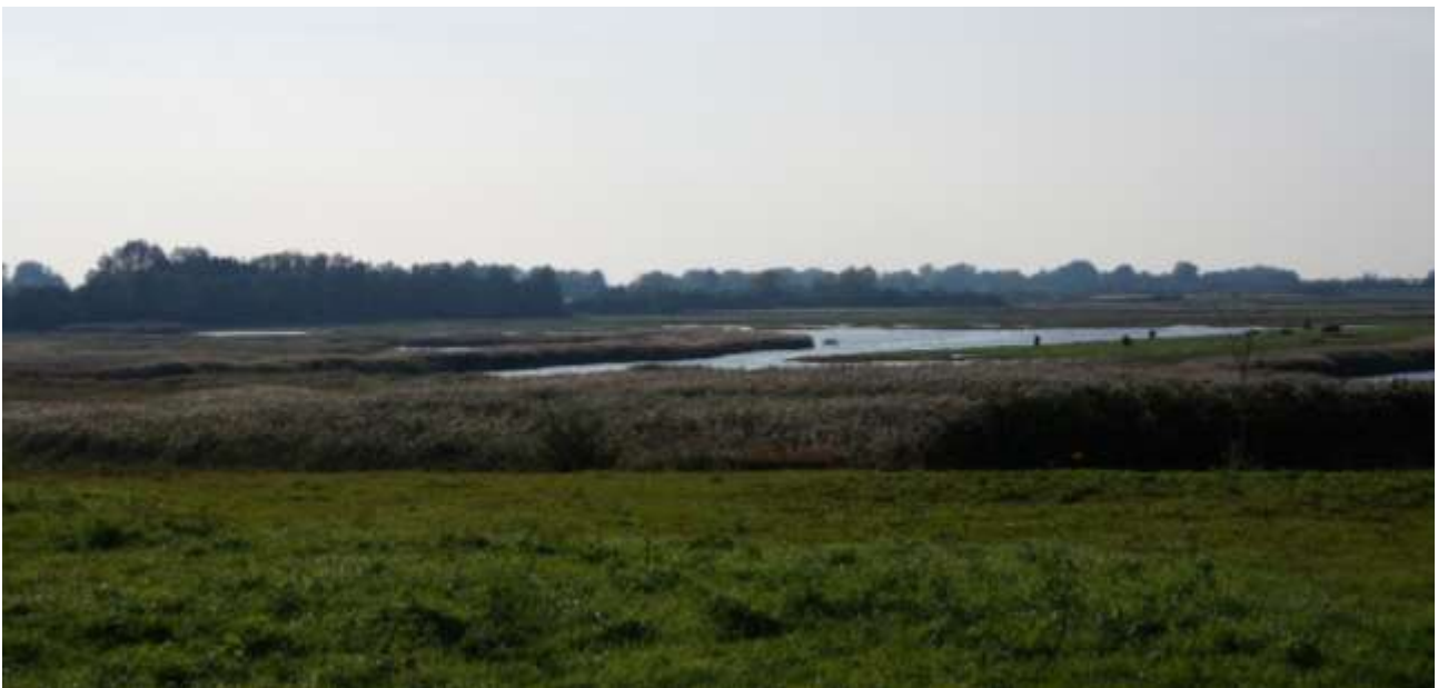
Vandhullet F1, laguner og oversvømmelser på strandengen syd for Kostræde Banke er kommunens vigtigste område for grønbroget tudse. September 2017.

Den lille bestand af grønbroget tudse mellem Køng og Lundby, der holder til i nogle igangværende lergrave, er besøgt nogle gange i foråret 2017. Der er optalt 5 kvækkende hanner.