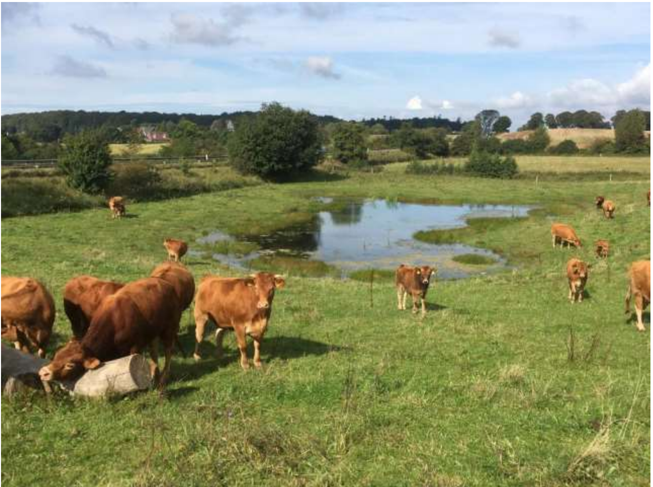
Løvfrø-vandhullet K5 der er beliggende ved Fladbækken nord for Nyråd.

Den store Sydsjællandske løvfrøbestand omkring Kulsbjerg Øvelsesplads har sit udspring i den store redningsaktion for løvfrøerne der udspandt sig fra slutningen af 1980'erne. Bestanden har senere, naturligt, etableret sig i en række mindre bestande fra Nyråd i vest til Langebæk i øst.