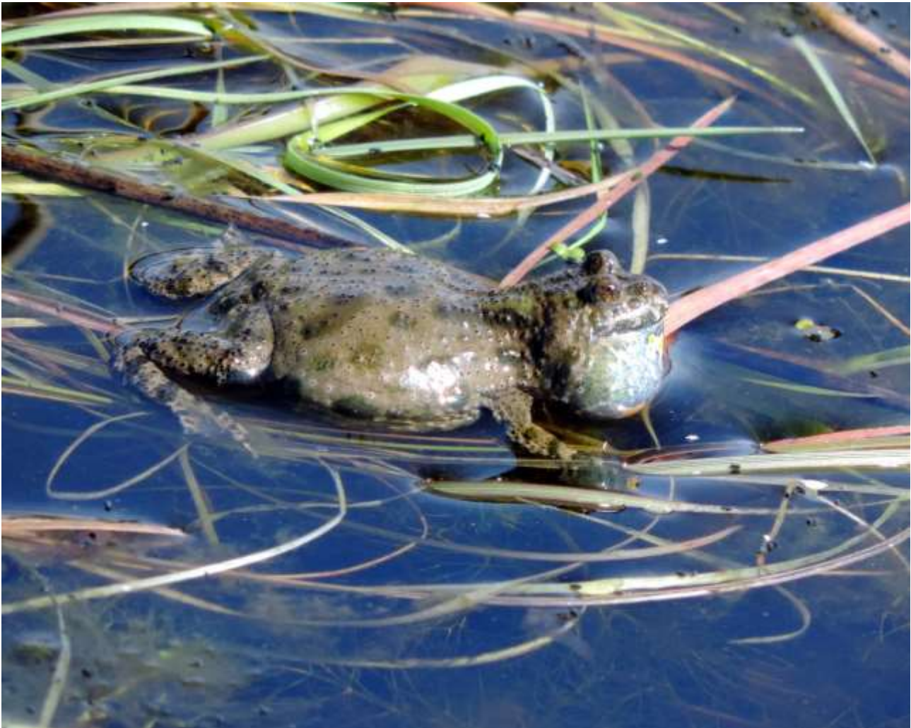
Klokkefrø fra Knudsskov, B21, Maj 2017.

Klokkefrøen er meget afhængig af vandkvaliteten i såvel yngle- som fourageringsvandhuller. Der skal således findes lavvandede vandhuller, som ikke tørrer ud henover sommeren. Samtidig er det vigtigt, at der i tilknytning hertil findes dybere permanente vandhuller, hvor den kan søge føde. Prædation fra fisk på æg og yngel og fra hejrer på voksne individer kan undertiden være en trussel for lokale bestande. Desuden trives arten bedst, hvor omgivelserne er ekstensivt græssede arealer eller overdrev, gerne med en udyrket bræmme omkring det enkelte vandhul.