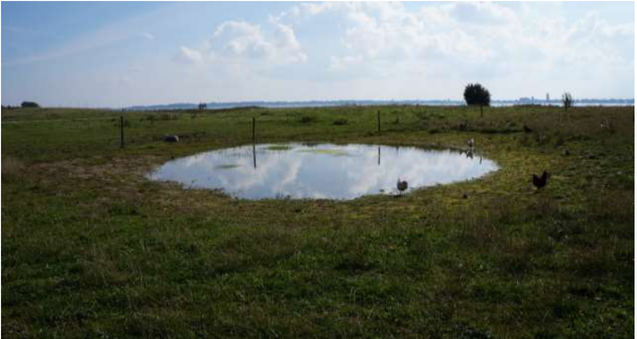
Den succesfuldte yngledam sommer 2017