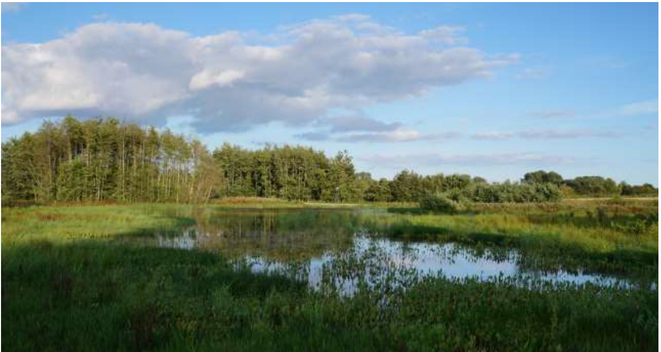
Det nye vandhul (2015), P6, der har huset Løvfrøer i både 2016 og 2017.

Der er registreret 28 kvækkende hanner i 6 vandhuller (P2, P4, P5, P6, P8, P9).