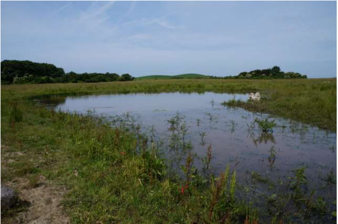
Det nyetablerede "fladvand", B7, i nordkanten af Paradiset tiltrak allerede i sin anden sæson 12 kvækkende klokkefrøer.