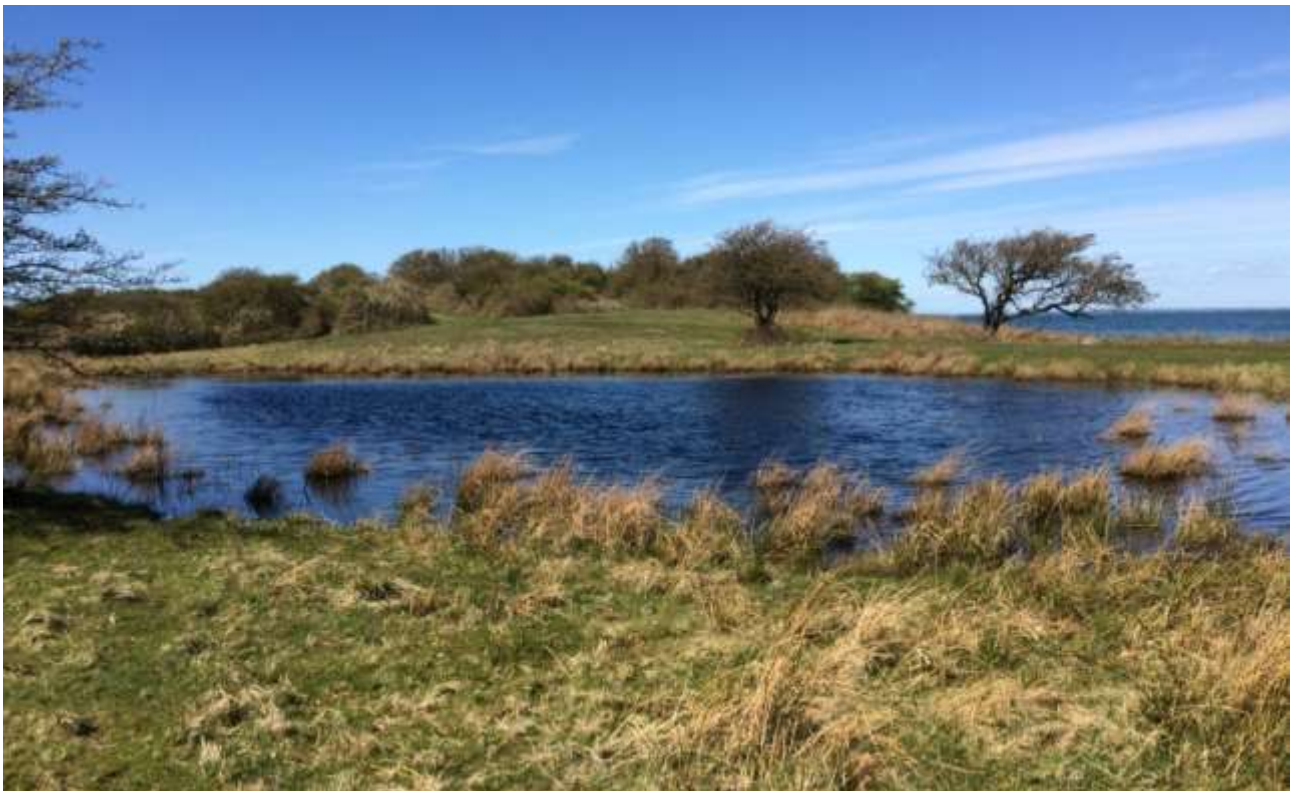
Vandhul A20 på Knudshoved hvor der i 2017 blev registreret 6 kvækkende løgfrøer