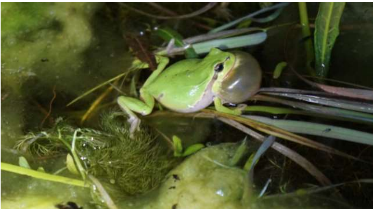
Kvækkende løvfrøhan fra Knudshoved, maj 2017.

Der er i Vordingborg kommune i 2017 registreret 658 kvækkende løvfrøer i 66 vandhuller. Løvfrøen findes i tre adskilte bestande: 1) Knudshoved og Knudshoved Odde, 2) den store Løvfrøbestand samlet omkring Kulsbjerg Øvelsesplads og 3) Præstø-bestanden omkring Roneklint på Jungshoved. Herudover findes en meget lille, isoleret bestand i skoven Nygårds Have nord for Vordingborg.