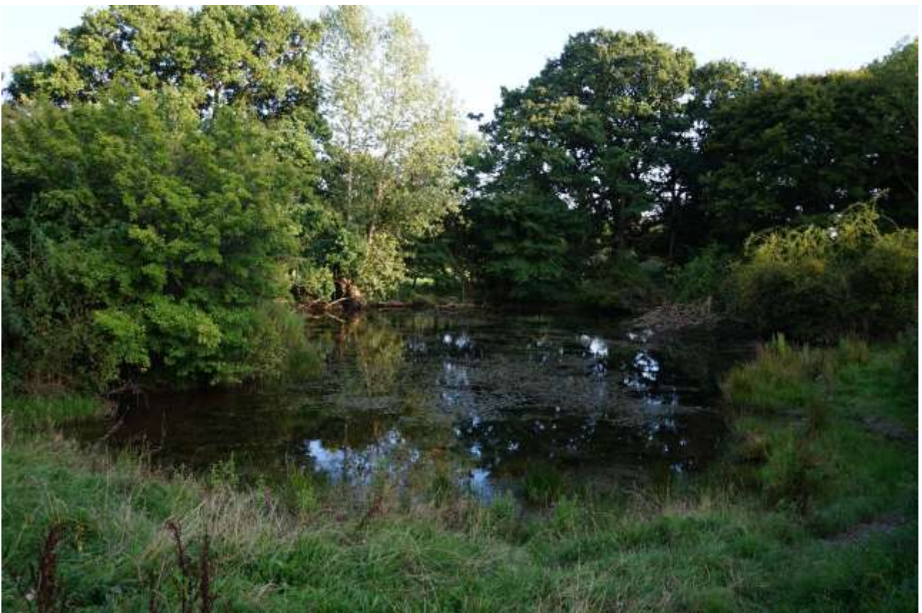
Det oprindelige løvfrø-vandhul, P5, i Bøndernes Egehoved

Der er i siden 1989 gjort en betragtelig indsats for den lille, isolerede bestand af løvfrøer på Jungshoved. I de seneste 4 år er der gjort endnu en stor anstrengelse for løvfrøerne omkring Roneklint med gravning af flere nye vandhuller og etablering af ekstensiv græsning omkring disse, bl.a. med stor støtte fra Den Danske Naturfond. Flere af de nye vandhuller (P6, P8, P9) er da også indtaget af kvækkende hanner i 2016 og 2017, så en vis spredning kan konstateres. Det oprindelige vandhul (P5) ligger endnu lidt skyggefuldt og har ikke genvundet fordums styrke med indtil 100 kvækkende hanner.