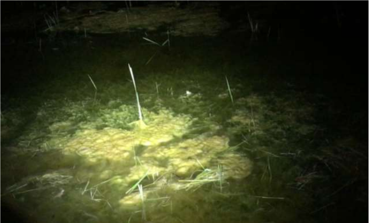
På billedet ses en kvækkende grønbroget tudse mellem voldgravens alger og vandplanter.