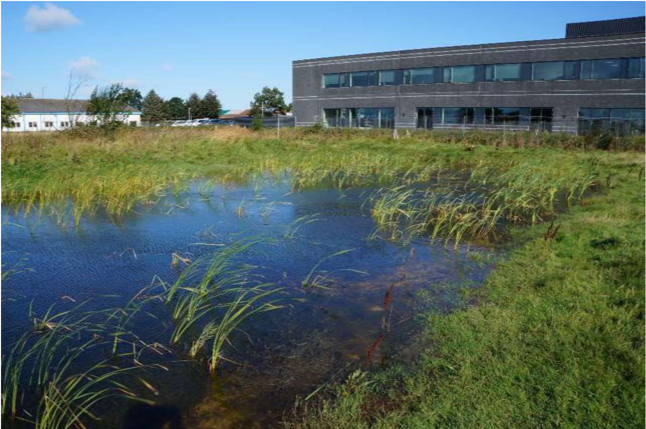
Vandhullet J3 (Køkkensøen) ligger syd for Vordingborg Køkkenets nye administrationsbygning på Langøvej i Vordingborg. Søen har en meget fin vandkvalitet, men desværre mange dunhammer.