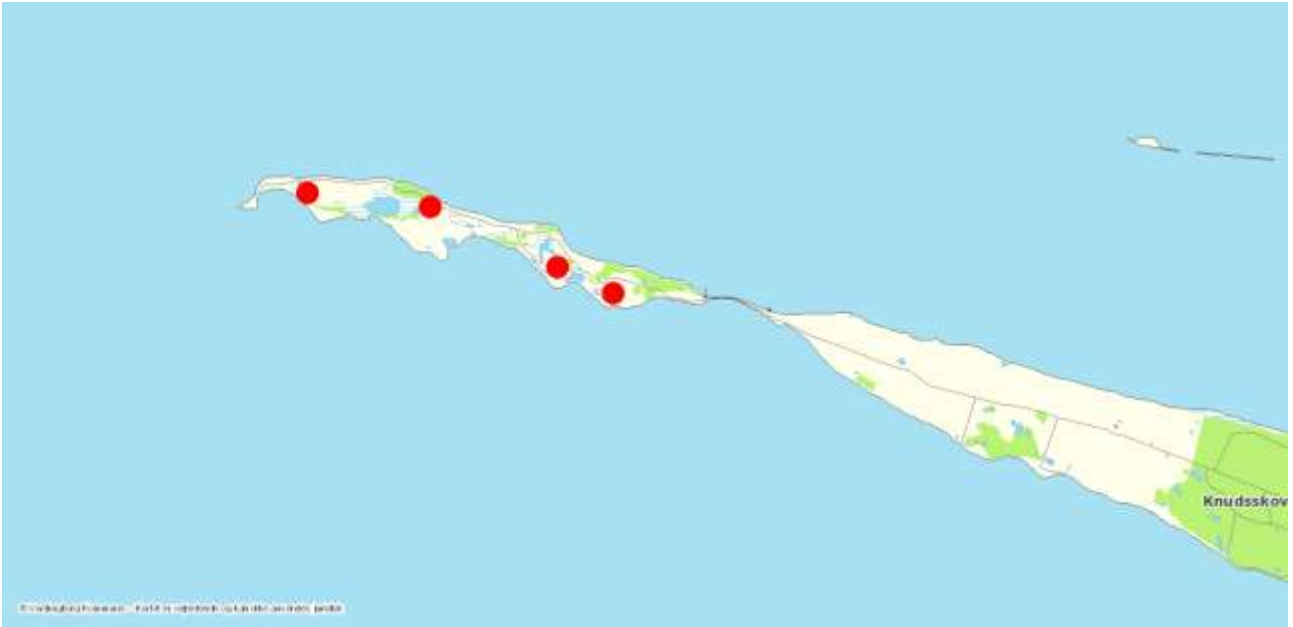
Vandhuller med kvækkende Løgfrø i 2017