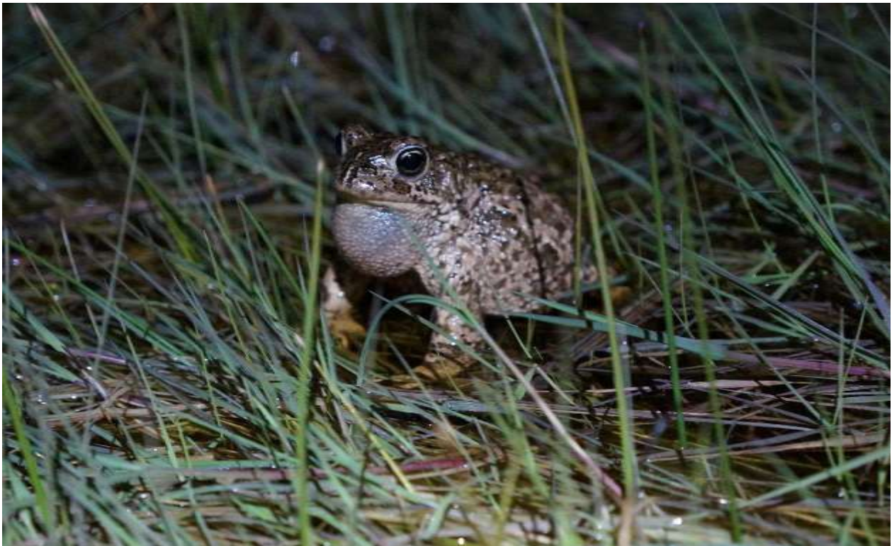
Kvækkende strandtudse på Knudshoved den 9. maj 2017