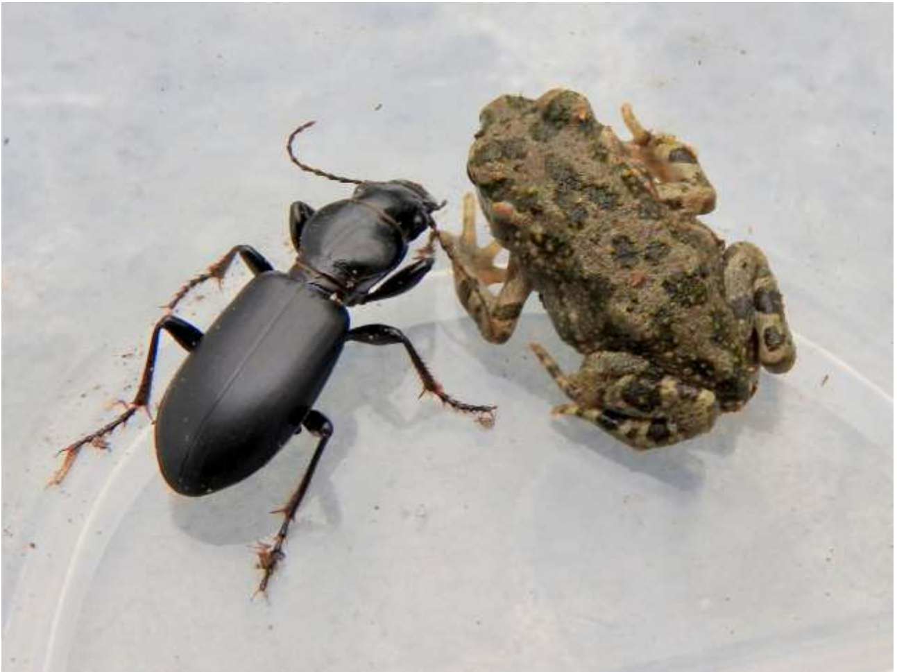
Nyforvandlet grønbroget tudse og løbebille.