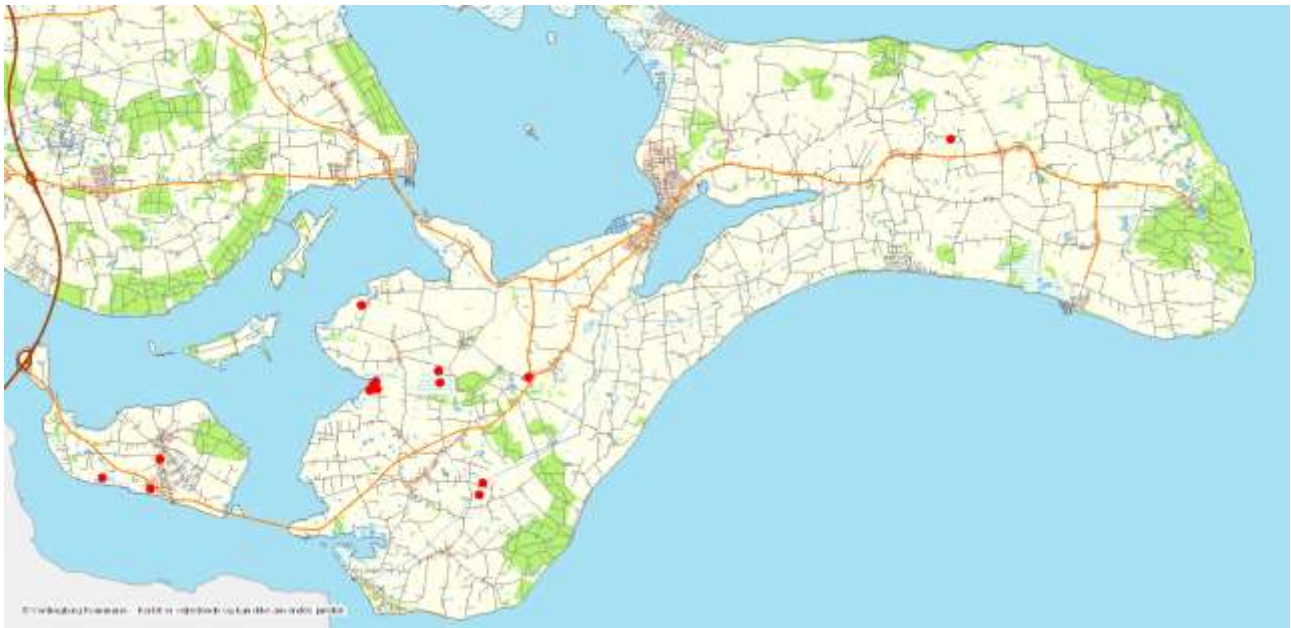
Vandhuller på Farø, Bogø og Møn hvor der er registreret grønbroget tudse i 2017