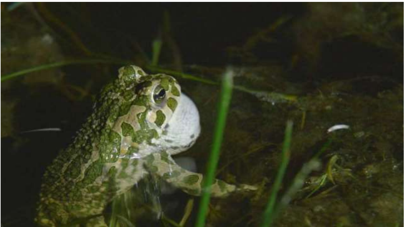
Kvækkende Grønbroget Tudse i Gåsesøen (C2) på Avnø.

Grønbroget tudse findes i Vordingborg i tre adskilte bestande: 1) bestanden på Svinø, sydsiden af Dybsø Fjord, Avnø Fjorden og Knudshoved, 2) bestanden i Vordingborg og 3) bestanden på Bogø og Vestmøn. Hertil kommer helt isolerede forekomster (få individer) ved Lundby og Elmelunde.