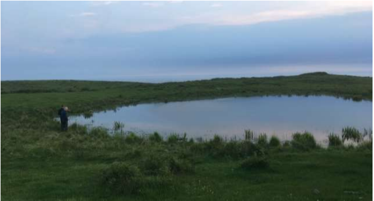
Vandhullet A9 hvor der i 2017 vurderes at være over 200 voksne klokkefrøer.