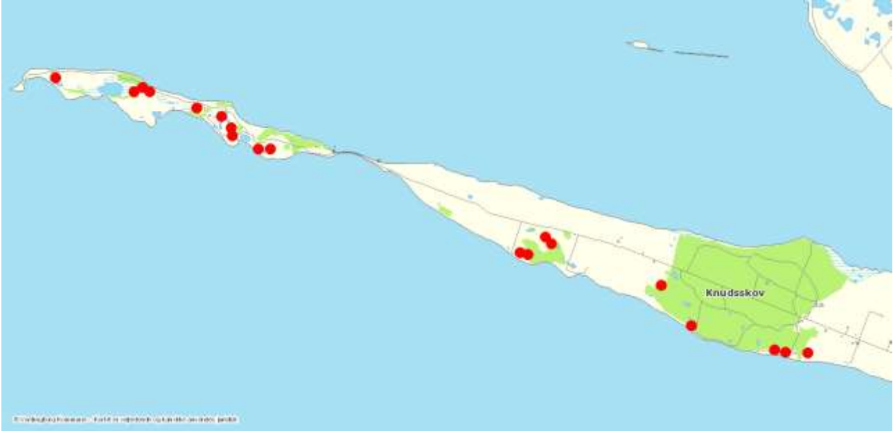
Vandhuller med Klokkefrøer i 2017.

Klokkefrøbestandene er overvåget intensivt forår og sommer 2017.