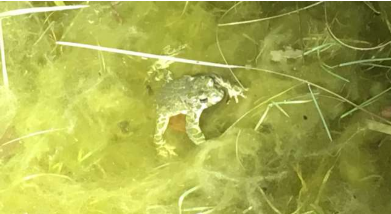
En grønbroget tudsehun i voldgravens vand.