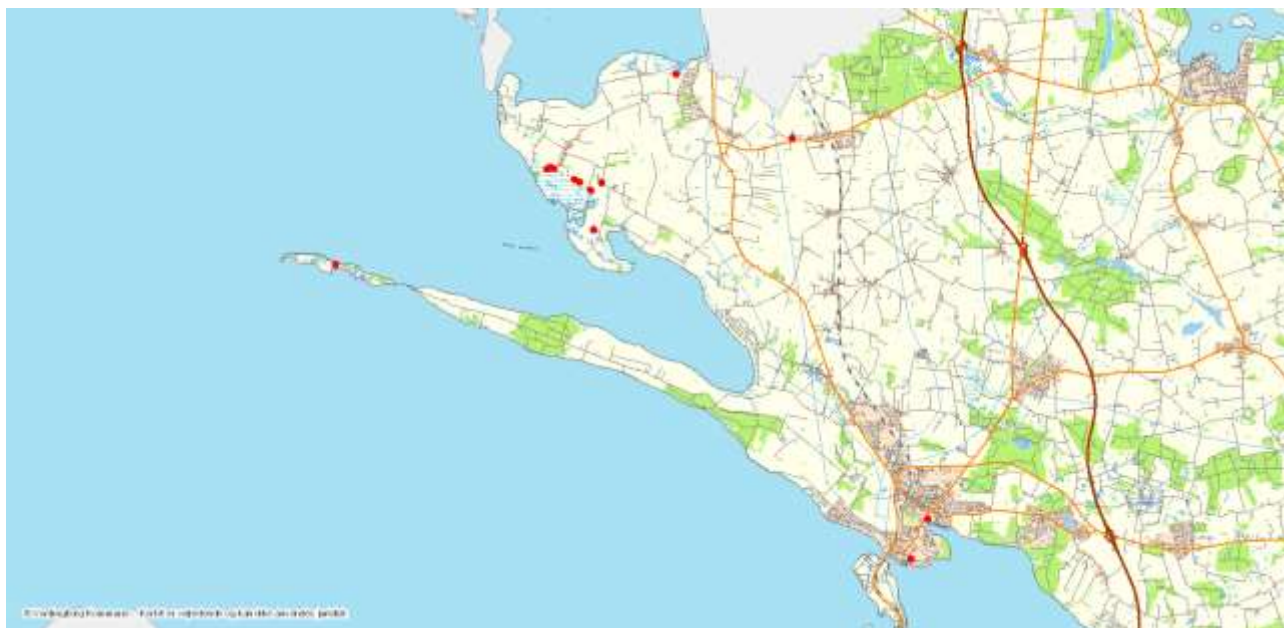
Vandhuller på Sjællandssiden af Vordingborg kommune med Grønbroget Tudse i 2017