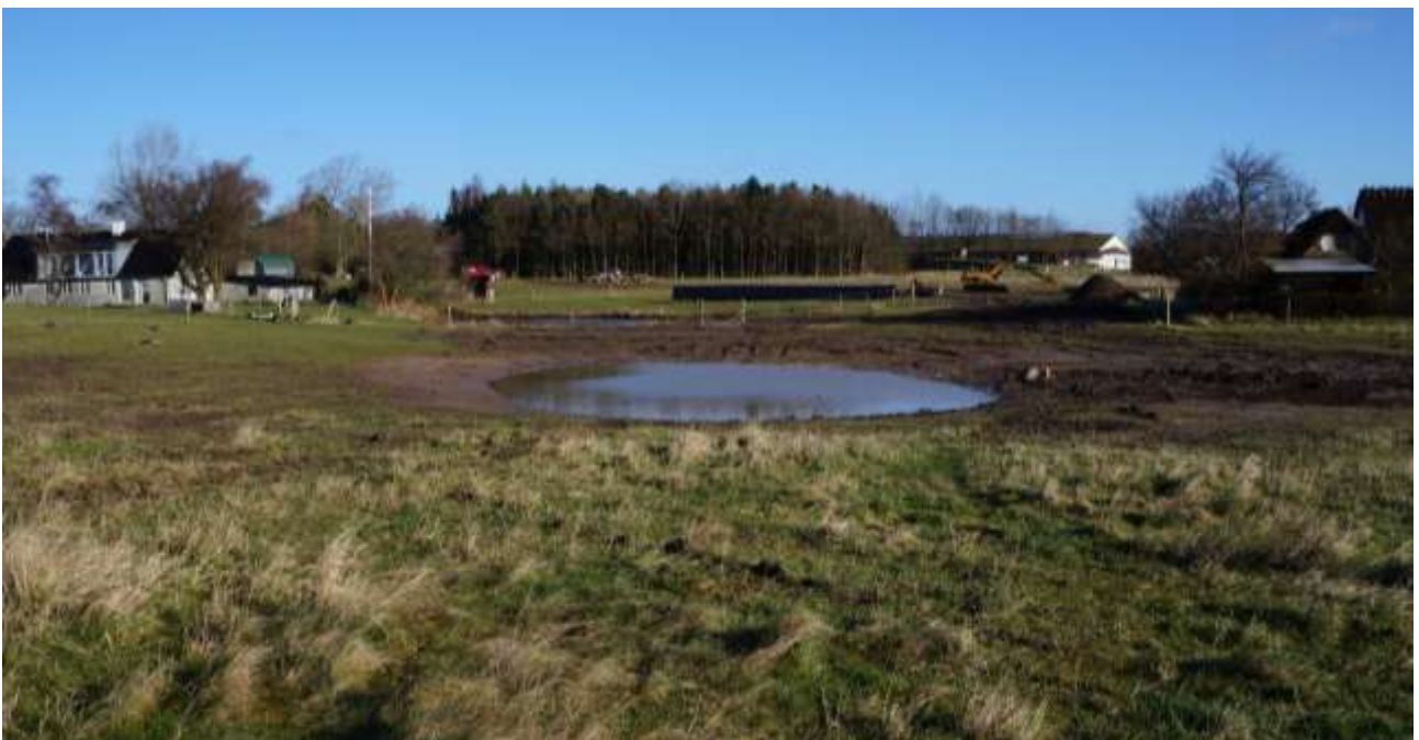
Oversigt over projektområdet. Forrest den omtalte yngledam. Til højre ligger der en lidt større dam. Ved huset (tv) ligger det oprensede vandhul og ved gravemaskinen er det tredje vandhul ved at blive gravet.