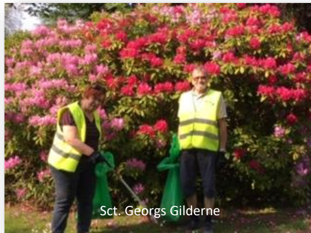
Sct. Georgs Gilderne

Find her link til alle de gode historier i Vordingborg Kommune her: samlede artikler om foreninger der er aktive i Ren Natur