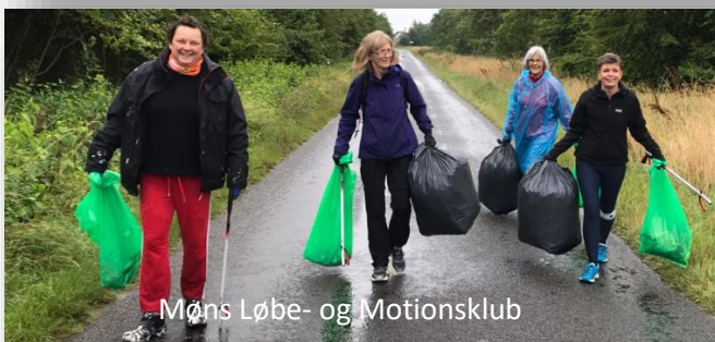
Møns Løbe- og Motionsklub