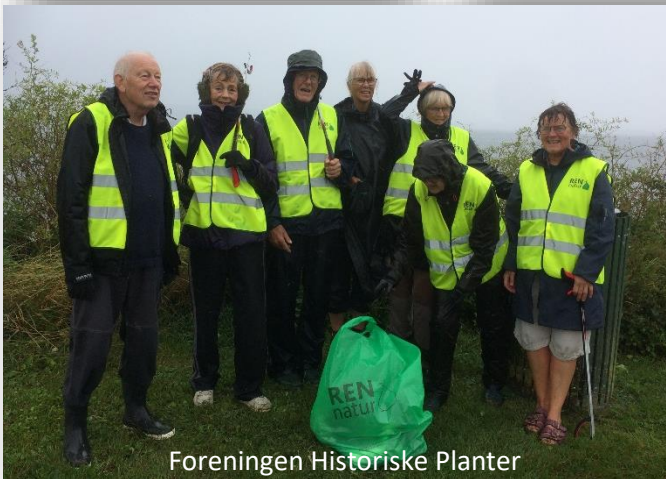
Foreningen Historiske Planter