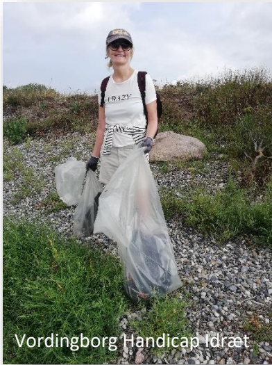
Vordingborg Handicap Idræt