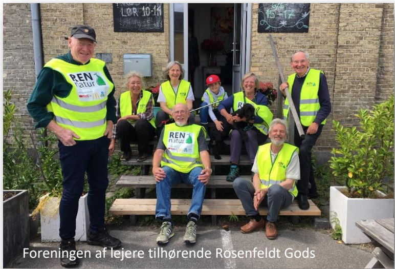
Foreningen af lejere tilhørende Rosenfeldt Gods