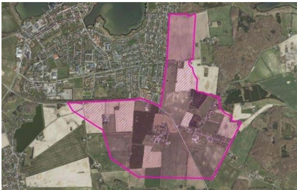
Ønske til udviklingsområde ved Præstø

Vi vil ansøge staten om udlæg af et større udviklingsområde øst for byen – omfattende Lundegård og Enegårde. Udlægget skal sikre, at der inden for området kan ske udviklingstiltag, som kan understøtte landsbyerne og fremtidig byvækst ved Præstø. Afgrænsningen af området tager udgangspunkt i landskabsanalyser og naturudpegninger i form af ”Grønt Danmarkskort”.