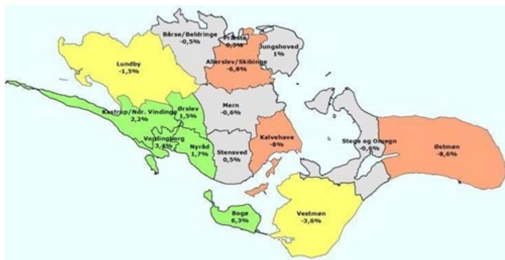
Udviklingen i indbyggertallet i de 16 lokalområder (2012-2019)

Befolkningsudviklingen varierer geografisk, hvor området omkring Vordingborg i perioden 2012-2019 har oplevet fremgang, mens andre dele af kommunen har haft tilbagegang i indbyggertallet. Se nedenstående kort.