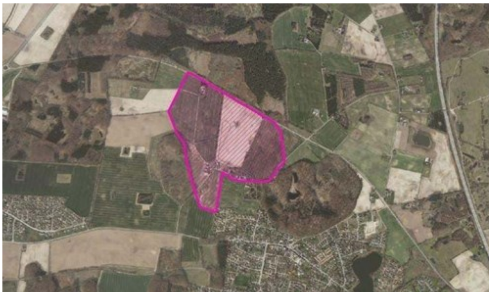
Ønske til udviklingsområde ved Nyråd/Græsbjerg

Gennem natur- og landskabsanalyser kan der udpeges et større udviklingsområde omkring Græsbjerg. Udbygningen ligger i forlængelse af allerede planlagte områder i Nyråds nordvestlige hjørne, og vil muliggøre en fremtidig byvækst, samt skabe udviklingsmuligheder for landsbyen Græsbjerg.