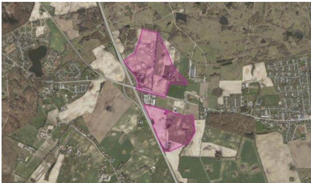
Ønske til udviklingsområde ved Afkørsel 41 - Kystnærhedszonen markeret med brun streg

En del af det nordlige område indgår i dag i udpegningerne for Grønt Danmarkskort. Der er dog tale om landbrugsområder, som ikke er sammenhængende med de øvrige udpegninger i det grønne danmarkskort, da Forsvarets har nedlagt veto i forhold til udpegningen af sammenhængende natur på deres områder. Udviklingsområdet vil således forudsætte, at Grønt Danmarkskort revideres ved den kommende Kommuneplanrevision.