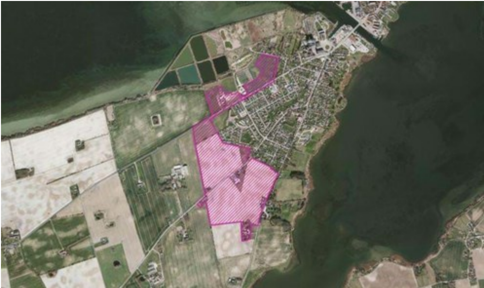
Ønske til udviklingsområde ved Stege (Lendemarke)

Vi vil ansøge staten om udlæg af et udviklingsområde omkring Lendemarke, dels op til jordbassinerne og dels ud langs Grønsundsvej, hvor afgrænsningen tager udgangspunkt i de større bygningsæt, der ligger i dette landskab. Afgrænsningen tager herudover udgangspunkt i udpegning af oversvømmelsestruede arealer, landskabsanalyse og naturudpegninger i form af "Grønt Danmarkskort".