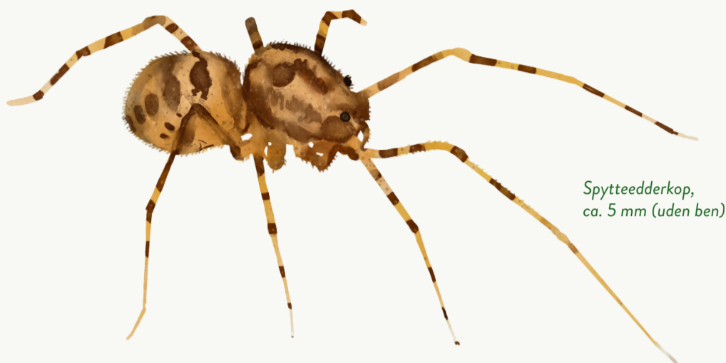
Spytteedderkop, ca. 5 mm (uden ben)

Spytteedderkoppen kan jage dyr, der er større end den selv.