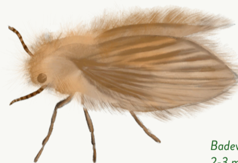
Badeværelsemyg, 2-3 mm