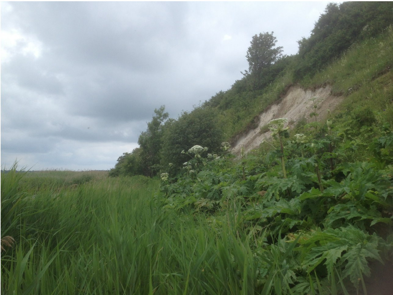
Kæmpe-Bjørneklo på kystskrænt. Stege Nor, juni 2014.