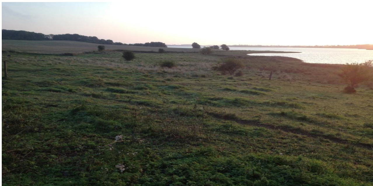
Udsigt over afgræsset strandeng og rigkær ved vest-enden af Stege Nor.

Projekterne gennemføres ved frivillige aftaler, og derfor er det i mange tilfælde ikke på nuværende tidspunkt muligt at beskrive hvornår projekterne fysik bliver udført. Kommunen vil i hvert enkelt tilfælde sørge for, at relevante interessenter bliver inddraget.