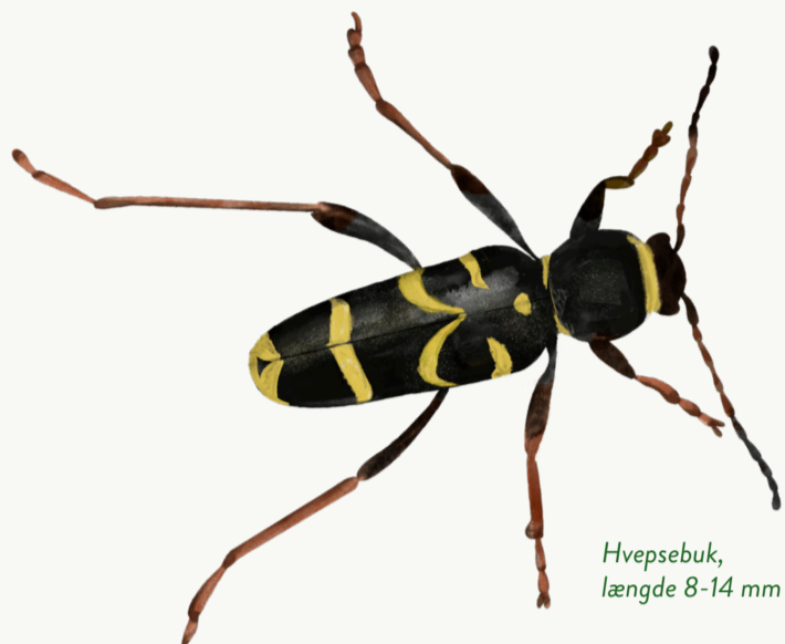
Hvepsebuk, længde 8-14 mm