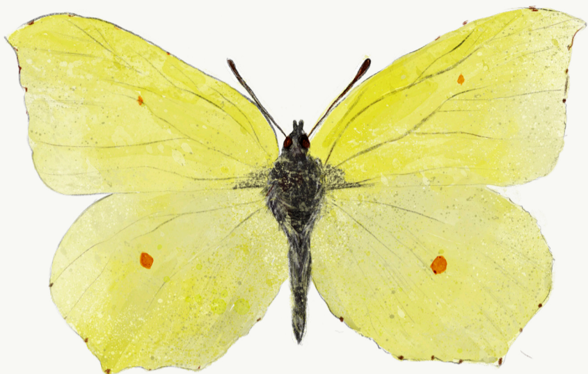
Citronsummerfugl, han, vingefang 55-64 mm