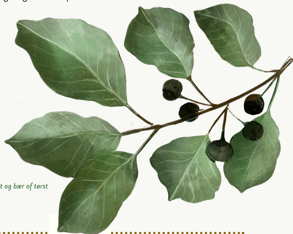
Kvist og bær af tørst

Tørst og citronsummerfugle hører til de arter, du let kan invitere ind i din have.